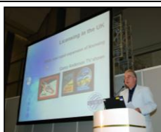
LIMAライセンスセミナー