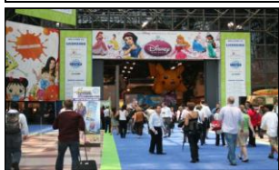
LIMAライセンスショー (ラスベガス、東京、ロンドン、 ミュンヘン、香港、上海、ドバイ等)