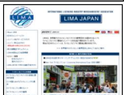
LIMA ジャパン HP