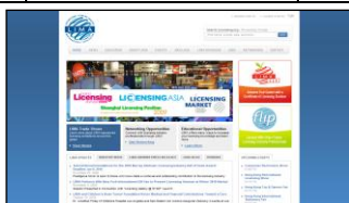
LIMA メンバー専用ウェブサイト (本部英語版)